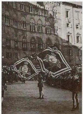
△ Vendelen in Siena.

Ondanks de landsgrenzen, ondanks de verschillende tradities en ondanks de verschillende historische gebeurtenissen in de besproken gebieden zijn de overeenkomsten bij het vendelen groot. Hetgeen je makkelijk terug kunt zien in de maten, in de systematiek en in de diverse figuren. Van de totaal drie stukken die ik nu over het vendelen heb geschreven is mijn belangrijkste constatering dat – ondanks de praktische verschillen in uitvoering – vlaggengebruik door de eeuwen heen in verschillende hoedanigheden een belangrijke vorm van expressie is geweest binnen de Europese cultuur, dat voornamelijk door het schutterswezen tot op heden in ere wordt gehouden.