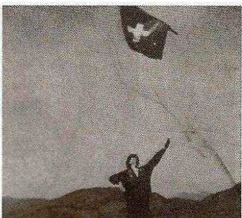
△ Zwitsers vendelen.

nodig om een volleerd beoefenaar van deze kunst te worden. Men moet vele spectaculaire figuren (zoals het hoog naar boven gooien) sierlijk in elkaar over laten lopen, waarbij allerlei ongeschreven (en dus voor mij onbekende) regels in acht worden genomen.