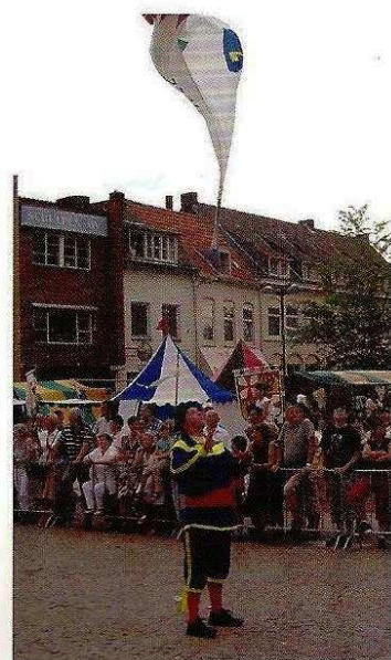
△ Vendelier uit het Noord-Franse Lille.

Bron: Toorians, J., Het vendel , (1969).